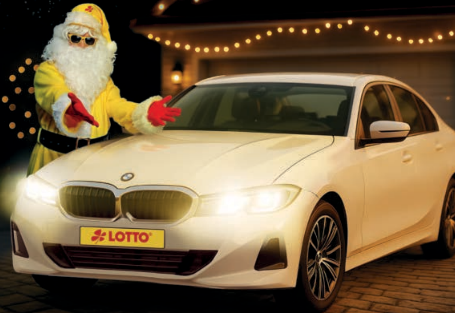
Abb. Modellbeispiel, teilw. KI-generiert