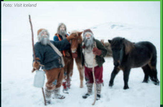
Weihnachten ist die Zeit der Trolle.

dass dort zur Winterzeit ein Weihnachtsmarkt isländischer Art stattfindet, bei dem Trolle die Hauptrolle spielen.