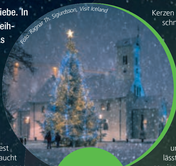
Weihnachtliche Stimmung vor dem Dom von Reykjavik.

Den Auftakt macht beispielsweise der Stekkjarstaur (deutsch Schafschreck) und stiehlt die Milch der Mutterschafe. Am 16. Dezember taucht dann der Pottaskefill (Topfschaber) auf. Er stibitzt die Essensreste aus den Kochtöpfen. Am 19. Dezember schleckt der Skyrgámur (Skyrschlund) die Töpfe aus. Er hat eine Vorliebe für den Skyr, ein seit einigen Jahren auch bei uns beliebtes joghurtähnliches isländisches Milchprodukt. Am 23. Dezember versucht dann der Ketkrókur (Fleischkraller) den Weihnachtsbraten zu stehlen. Und am Heiligen Abend muss man auf die