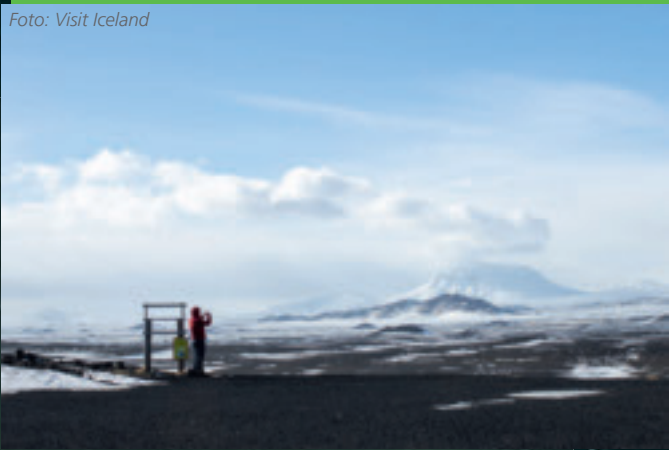
Schnee und Eis: Winterstimmung im isländischen Hochland.

sie es besonders auf faule Kinder abgesehen, die bis Weihnachten die Wolle noch nicht gesponnen haben. Wer dann am Aðfangadagskvöld, dem Heiligen Abend, ohne neue Kleidung dasteht, den holt sich die Katze. Diese dramatische Legende sollte die Kinder auf der unwirtlichen und kalten Insel dazu erziehen, sich rechtzeitig auf den harten Winter vorzubereiten. Auch heute sind die Eltern lieber vorsichtig und deswegen liegt traditionell auf jedem isländischen Gabentisch mindestens ein Kleidungsstück. Besonders gerne werden Socken verschenkt.